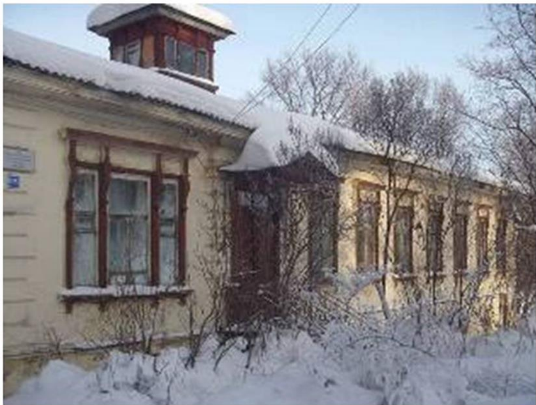
Дом детства Е. И. Чарушина

Отец Жени Чарушина был архитектором и художником. Ватман, тушь, краски - все это нравилось мальчику.