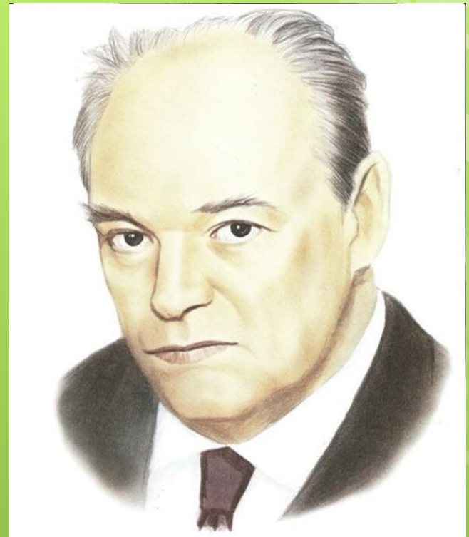
Евгений Иванович Чарушин